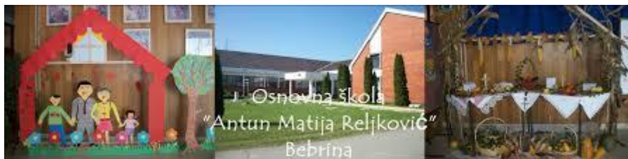
Slika 6: Osnovna škola Bebrina

Učenici V-VIII razreda iz naselja Općine putuju u matičnu školu u Bebrini.