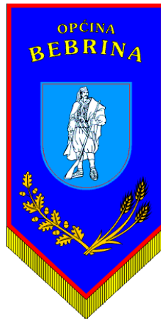
Slika 2. Zastava općine Bebrina

Naselja općine Bebrina, a pogotovo Bebrina i Kaniža posjeduju specifičan oblik gradnje, s velikim travnatim površinama koje se nalaze u sredini naselja, s kućama s jedne i druge strane. Tradicionalne ceste omeđene kanalima se također nalaze uokolo travnate površine. Općina se trudi zadržati taj tradicionalni oblik gradnje, te se radi i na očuvanju vegetacijskog pokrova tih površina, kako bi se zadržao tradicijski izgled sela u općini.