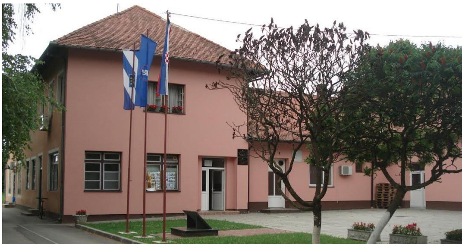
Slika 5: Zgrada općinske uprave

Na području općine Bebrina osnovano je 7 mjesnih odbora : Banovci, Bebrina, Dubočac, Kaniža, Stupnički Kuti, Šumeće i Zbjeg.