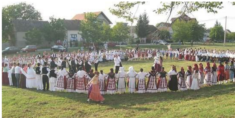
Slika 4. Bebrina

Naselja općine Bebrina, a pogotovo Bebrina i Kaniža posjeduju specifičan oblik gradnje, s velikim travnatim površinama koje se nalaze u sredini naselja, s kućama s jedne i druge strane. Tradicionalne ceste omeđene kanalima se također nalaze uokolo travnate površine. Općina se trudi zadržati taj tradicionalni oblik gradnje, te se radi i na očuvanju vegetacijskog pokrova tih površina, kako bi se zadržao tradicijski izgled sela u općini.