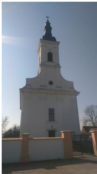
Slika 8: Crkva Sv. Marije Magdalene – Bebrina

Crkva je kasnobarokna-klasicistička, s užim polukružnim svetištem i bočnom sakristijom. Izgrađena je 1821. godine. Korpus zvonika ukomponiran je u pročelje, te zaključen kapom u obliku zvonolike kupole s lanternom. Tri prozorska otvora su ostakljena vitrajima. Na zabatu je okulus. Prozori na zvoniku imaju polukružni nadvoj. Pročelje i zvonik su vertikalno raščlanjeni pilastrima. Dva traveja lađe i jedan u svetištu imaju svodove u obliku češke kape. Iznad apside je polukalota. Osnovni materijali od kojih je crkva građena su opeka i drvena građa. Unutrašnjost je opremljena vrijednim baroknim inventarom, propovjedaonicom, oltarima, klupama i klecima koji su oblikovani u duhu klasicizma.