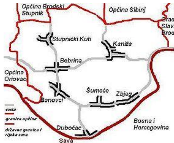
Slika 1. Općina Bebrina

naseljenosti sa do 50 stanovnika po kilometru kvadratnom. Općina se prostire na 100,32 km 2 .