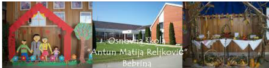
Slika 6: Osnovna škola Bebrina

Učenici V-VIII razreda iz naselja Općine putuju u matičnu školu u Bebrini.