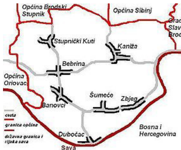
Slika 2. Općina Bebrina

Općina Bebrina sastoji se od naselja Banovci, Bebrina, Dubočac, Kaniža, Stupnički Kuti, Šumeće i Zbjeg. Prema popisu stanovništva iz 2011. godine, općina broji 3.244 stanovnika, raspoređenih na 971 kućanstvo te kao takva spada u općine s relativno niskom gustoćom naseljenosti sa do 50 stanovnika po kilometru kvadratnom. Općina se prostire na 100,32 km 2 .