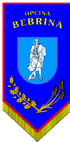
Slika 3. zastava općine Bebrina

Zastava općine Bebrina je u plavom srebrni graničar . Radi se o liku vojnika graničara iz vremena Vojne Krajine u karakterističnoj odori koji drži dugačku pušku. Zastava je plava s grbom u sredini obrubljenim crveno i plavo. Svečana zastava je pravi trokutasto završavajući gonfalon s grbom u sredini obrubljenim crveno i plavo, iznad njega u dva luka žuti natpis OPĆINA BEBRINA, a ispod grba okružujući ga hrastova grančica i tri klasa žita.