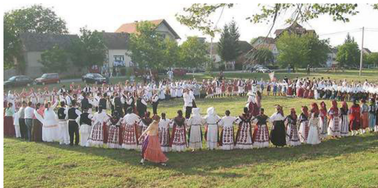
Slika 4. Selo Bebrina

Sela općine Bebrina, a pogotovo Bebrina i Kaniža posjeduju specifičan oblik gradnje sela, s velikim travnatim površinama koje se nalaze u sredini sela, s kućama s jedne i druge strane. Tradicionalne ceste omeđene kanalima se također nalaze uokolo travnate površine. Općina se trudi zadržati taj tradicionalni oblik gradnje, te se radi i na očuvanju vegetacijskog pokrova tih površina, kako bi se zadržao tradicijski izgled sela u općini.