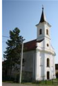
Slika 10:Crkva sv. Mihovila Arkandžela, Dubočac

Crkva je kasnobarokno - klasicistička građevina zaključena užim polukružnim svetištem. Izgrađena 1785. godine. Zvonik s atikom ukomponiran je u glavno pročelje, te zaključen šiljatom kapom. Iznad segmentno zaključenog portala s klasicističkim vratnicama nalazi se lučno zaključeni prozorski otvor, flankiran konkavno uvučenim nišama. U vrijeme izgradnjecrkva je imala svod, koji je zamijenjen tabulatom. Unutrašnjost crkve opremljena je vrijednim kasnobaroknim inventarom koji čine glavni oltar s oltarskom palom sv. Mihovila, kasnobarokna propovjedaonica natkrivena baldahinom, relikvijar sv. Križa iz 1745. godine i kamena škropionica na profiliranom podnožju.