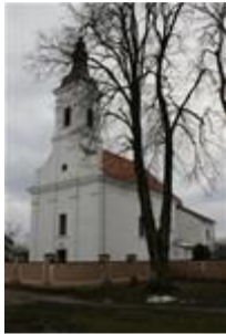
Slika 8: Crkva Sv. Marije Magdalene – Bebrina

zvoniku imaju polukružni nadvoj. Pročelje i zvonik su vertikalno raščlanjeni pilastrima. Dva traveja lađe i jedan u svetištu imaju svodove u obliku češke kape. Iznad apside je polukalota. Osnovni materijali od kojih je crkva građena su opeka i drvena građa. Unutrašnjost je opremljena vrijednim baroknim inventarom, propovjedaonicom, oltarima, klupama i klecalima koji su oblikovani u duhu klasicizma.