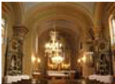
Slika 9: Inventar župne crkve sv. Marije Magdalene

Inventar župne crkve sv. Marije Magdalene dopremljen je 1825. g. iz požeške crkve sv. Lovre i skladno se uklapa u kasnobaroknu arhitekturu crkve. Čine ga glavni oltar, bočni oltari, propovjedaonica, orgulje, plastika raspeća Krista, slika sv. Antuna Pustinjaka, slika sv. Vida, klupe za vjernike, sakristijski ormar, kalež, svijećnjaci i kandilo. Inventar župne crkve sv. Marije Magdalene odraz je klasicističkog stila, osim dijela barokne plastike, koja se unatoč razlici stilova, skladno uklapa u interijer.