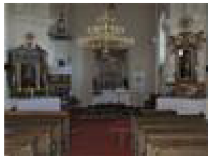
Slika 11:Inventar župne crkve sv. Mihovila Arkandžela

Inventar župne crkve sv. Mihovila Arkandžela u Dubočcu stilskih odlika kasnog baroka, većim je dijelom iz 18. st. i čine ga glavni oltar, bočni oltar, slika sv. Antuna Pustinjaka, slika sv. Jurja, plastika sv. Florijana, plastika sv. Mihovila Arkandžela, svijećnjaci, propovjedaonica, relikvijar, navicula, škropionica i raspelo, Oltarna pala s prizorom sv. Mihovila Arkandžela rad je broskog slikara Grubera. Oltar sv. Lucije, s retablom izveden je u polikromiranom drvu. Bočni oltar Majke Božje na prijelazu u svetište iz doba je rokoko. Središnja zona retabla je pravokutna s ostakljenom nišom u kojoj je plastika Madone s djetetom.